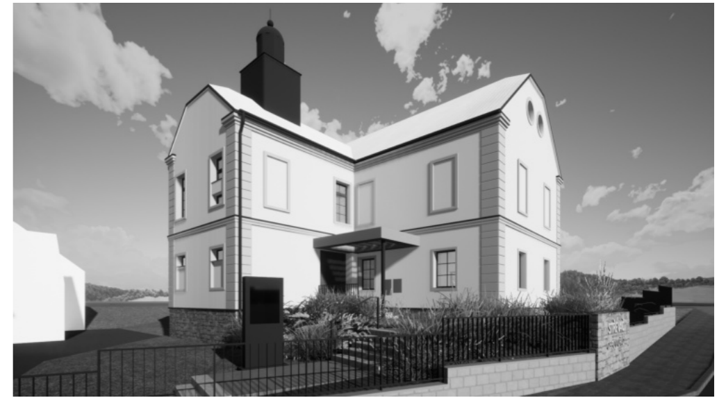
ARCHITEKTONICKÁ STUDIE REVITALIZACE OKOLÍ OBECNÍHO ÚŘADU STŘEVAČ