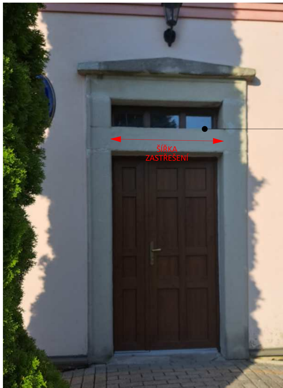
SKLENĚNÁ STŘÍŠKA V ÚROVNI PARAPETU HORNÍHO NADSVĚTLÍKU DVEŘÍ